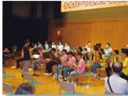
八尾中学校吹奏楽部