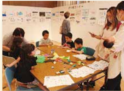
ワークショップ『折り紙』