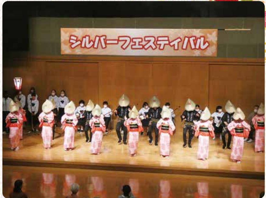
八尾中学校 郷土芸能部