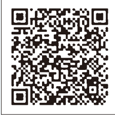
メール配信サービス QRコード

皆さん、富山市シルバー人材センター会員メール配信サービスへの登録は、お済みでしょうか？