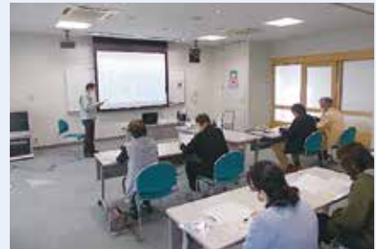
大久保ふれあいセンター