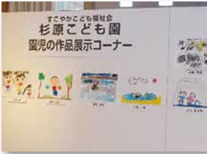
杉原こども園の作品展示

当日は、天候にも恵まれ、地元八尾中学校と杉原こども園の協力もあって、通常は、なかなか参加頂けない若い世代の方も多数来場され、約400名の参加と大成功で無事に終わることが出来ました。