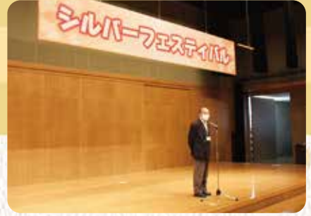
野原副理事長の挨拶