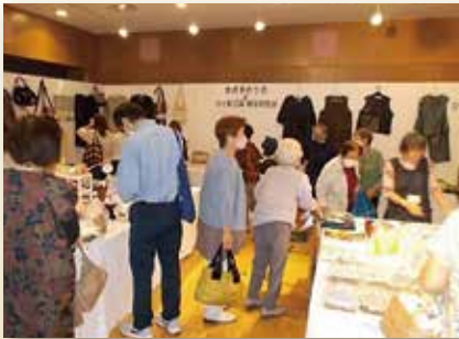
ひと針工房展示即売コーナー