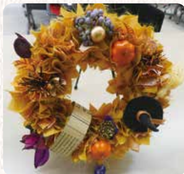
ハロウィンリース