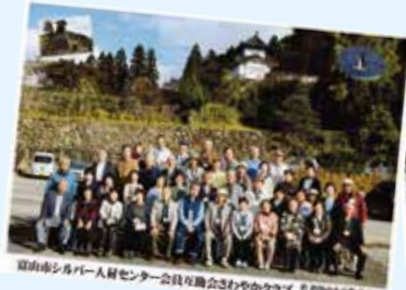
◆平成30年 但馬の小京都 出石