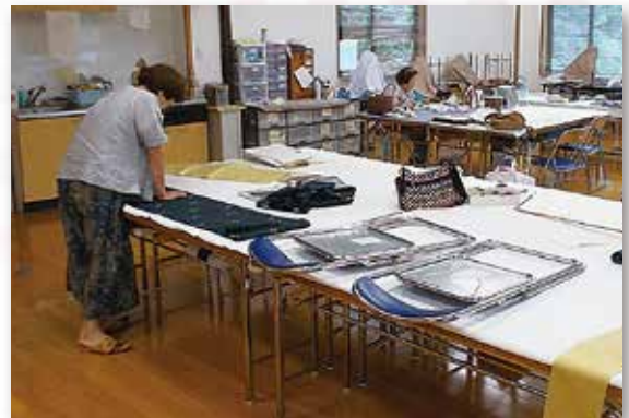
大沢野 ほのぼの工房