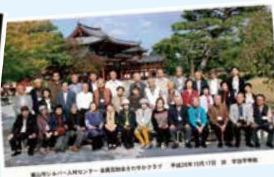
◆平成26年 宇治平等院