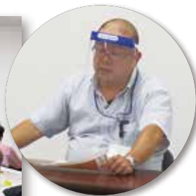
説明する森業務係長