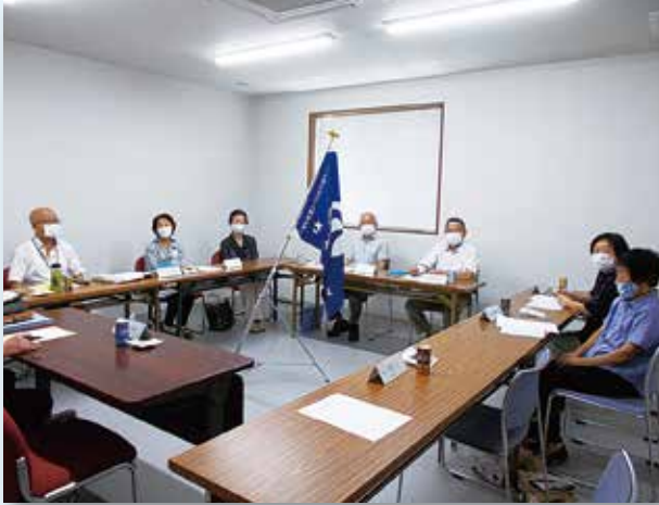
サークル室 (互助会室)